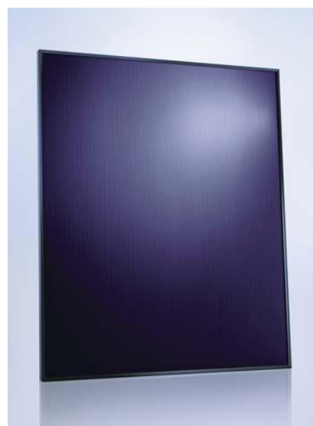
SCHOTT ASI™ 95/97/100/103